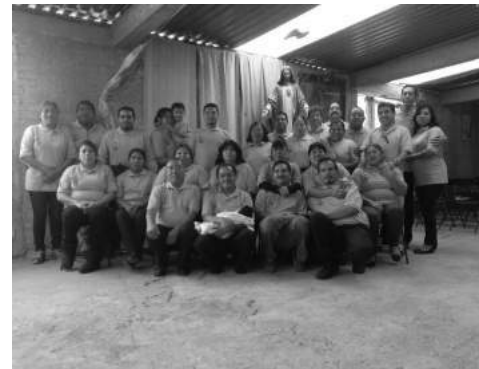
Sagrado Corazón de Jesús