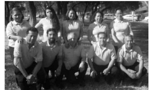
Equipo de Metodología