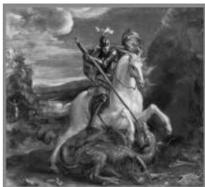
San Jorge 23 de Abril

Sobre la vida de este santo mártir constan dos hechos ciertos su existencia y su muerte en el martirio Las últimas reformas litúrgicas han pretendido eliminar su culto público. De hecho la Sagrada Congregación de Ritos suprimió del calendario la fiesta de san Jorge. Probablemente vivió y murió durante las persecuciones anteriores a Constantino en algún lugar cercano a Palestina. En Lyda de Palestina fue dedicada, en su honor, una basílica en el siglo IV, frecuentemente visitada por peregrinos de Jerusalén. En el año 1191 esta basílica fue destruida por el furor islámico de las tropas de Saladino.