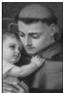
San Antonio de Padua 13 de Junio