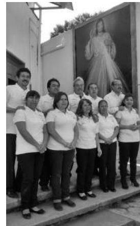
Cristo Resucitado “Fuentes del Valle”