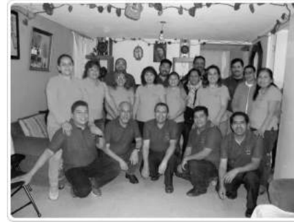
San Rafael Arcángel