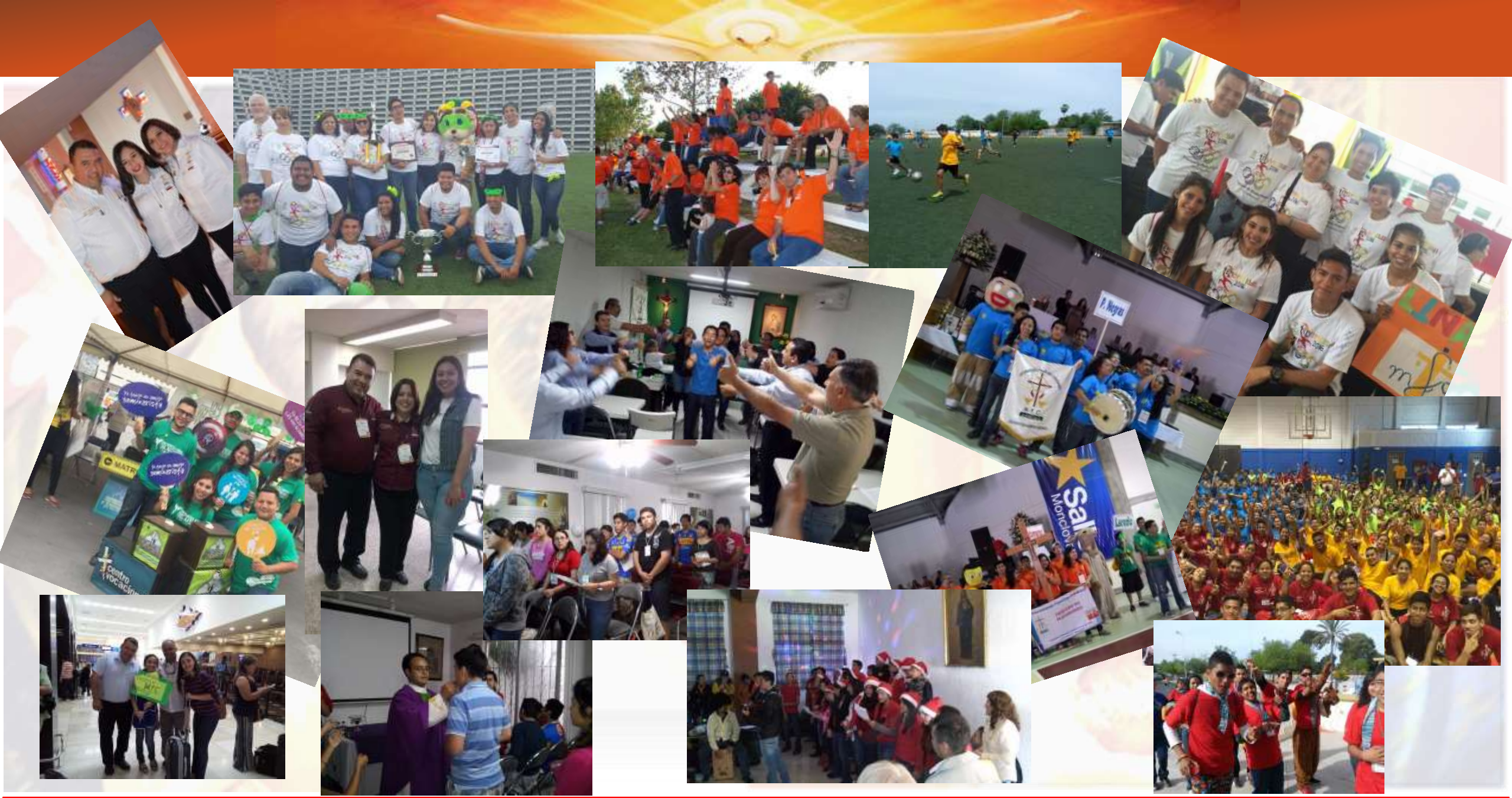
"Familias iluminadas por el Espíritu Santo: testimonio de fe, esperanza y misericordia"